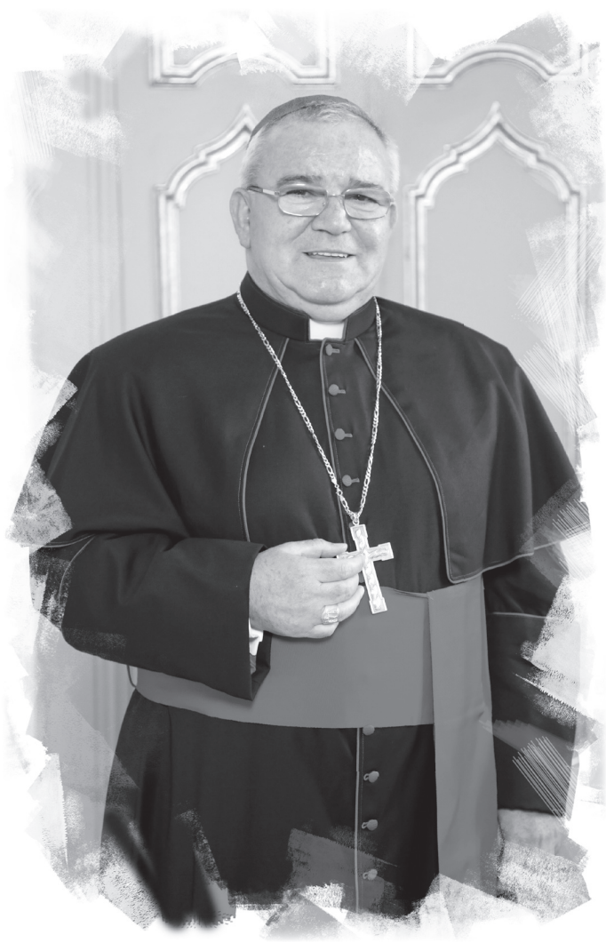
Mons. Vincenzo Carmine Orofino Vescovo di Tursi-Lagonegro