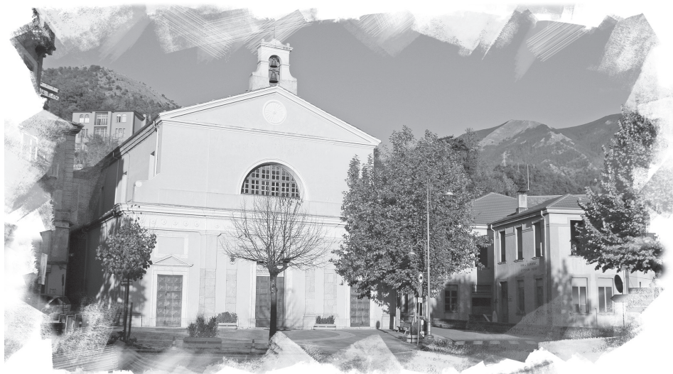
Concattedrale di Lagonegro