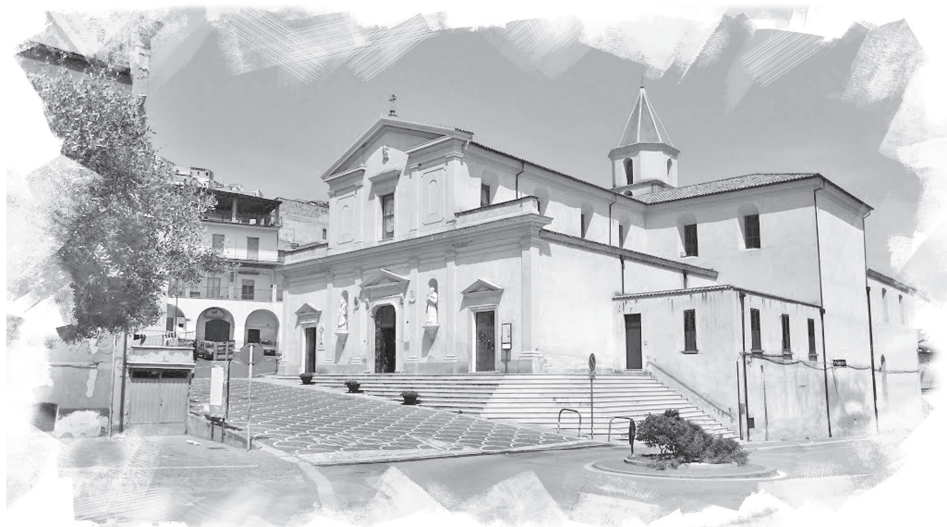
Cattedrale di Tursi