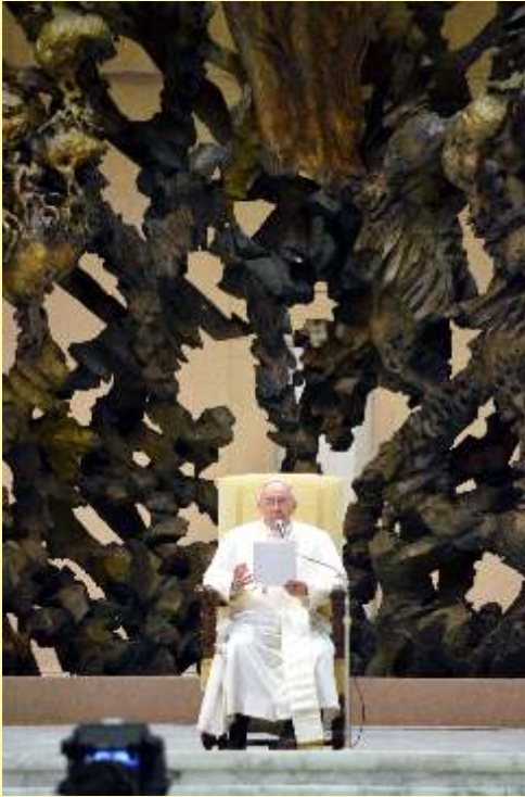
Papa Francesco ai giornalisti: «Vi voglio bene!». E spiega perché ha scelto quel nome

Francesco va', ripara la mia casa! «Come vorrei una Chiesa povera, una Chiesa per i poveri...». All'incontro con gli oltre seimila giornalisti che hanno seguito il conclave, Papa Francesco abbandona il testo preparato e racconta come e perché ha preso il nome del Poverello d'Assisi.